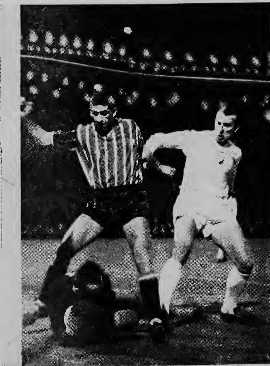
Nan Rotterdam Feyenoord tambe a coloca su mes pa final, despues di a derrota e club checo „Banik Ostrava" cu e score di 1-0. Riba e foto „Banik Ostrava ta salba milagrosamente di un goal.

Ultimo seman di invierno na Hulanda e caracteriz'e door di nieve cu a cai den hopi parti die luga. Ajera tambe nieve cal na gran cantidad cu na algun camina a ocasiona retraso den trafico. At aqui un idea die ciudad den invierno